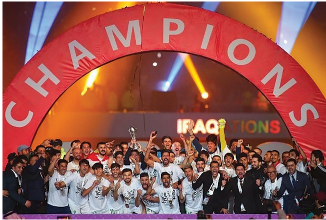
صورة (3) أثناء تتويج المنتخب العراقي بطلاً لكأس الخليج (الجابري، 2023)

3. أوضحت نتائج الدراسة حصول فئة "صور الاحتفالات المقامة على هامش بطولة كأس الخليج" على المرتبة الثالثة بتكرار مقداره (88) وبنسبة مئوية مقدارها (12.943%)؛ وقد وجدت الباحثان اهتمام المصورين بتغطية الاحتفالات المقامة على هامش البطولة، ولا سيما احتفالية الاختتام، وعلى الرغم من الاهتمام الكبير الذي حظي به هذا الحدث، إلا أن صور الافتتاح كانت ضئيلة جداً مقارنة بحجم الحدث؛ ويرجع ذلك إلى المشاكل التنظيمية التي حصلت أثناء الافتتاح، وعدم تمكن الكثير من المصورين الصحفيين من التواجد داخل الملعب؛ ومن ثم عدم قدرتهم على تغطية هذا الحدث، الأمر الذي انعكس على حجم التغطية، ولكن وجدنا عدد قليل من الصور التي ركزت على الفنان "محمود التركي" الذي كان أحد المشاركين في حفل الافتتاح، فضلاً عن التركيز على الحضور وأبرزهم "جيانى إنفانتينو" رئيس الاتحاد الدولي لكرة القدم، وأيضاً ركزت بعض الصور على جمال الملعب والإضاءة، وعلى خلاف ذلك نجد أن حفل الختام حظي بتغطية كبيرة بفعل تواجد المصورين الصحفيين وتمكنهم من تغطيته، إذ ركزت صورهم على عدّة أمور من بينها: توثق الفعاليات المقامة على أرض الملعب، كما تم التركيز على الفنانين المشاركين بحفل الختام وهم الفنان "ماجد المهندس" والفنانة "أحلام الشامسي"، ولكن التركيز الكبير كان على لحظة تتويج المنتخب العراقي بلقب البطولة، ومثال على هذه الفئة صورة (3) التي التقطها المصور الصحفي "منتظر الجابري":