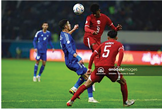
صورة (1) لاهد المباريات بكأس الخليج (السوداني، 2023)

2. حصلت فئة "صور الجماهير المشاركة في بطولة كأس الخليج" على المرتبة الثانية بتكرار مقداره (215) وبنسبة مئوية مقدارها (31.617%)، وفي هذه الفئة لاحظت الباحثان تركيز المصورين الكبير على الجماهير المشجعة سواء داخل الملعب أو خارجه، ولا سيما المشاهير منهم الذين حضروا مع الجماهير سواء كانوا من العراق أو من دول الخليج، كما تم التركيز بشكل كبير على الجماهير الحاملين للافتات ذات مضامين طريفة، إذ أن هذا النوع من الصور يتم تداوله بشكل كبير من قبل مستخدمي مواقع التواصل الاجتماعي لذلك نجدها تحظى باهتمام المصورين الصحفيين، ووجدت الباحثان أن المصورين لم يهتموا أيضاً بتوثيق توافد الجماهير إلى مدينة البصرة فضلاً عن توثيق لحظات توافدهم إلى الملاعب، بالمقابل لاحظت الباحثان قلة اهتمام المصورين بتغطية منطقة المشجعين خارج الملاعب التي كان لابد لهم من تسليط الضوء عليها، إذ لم تكن هذه الجماهير أقل شغفاً عن الجماهير المشجعة داخل الملعب لذلك كان من الممكن أن يتم تسليط الضوء على هذه الشريحة من الجماهير من قبل المصورين الصحفيين. ومثال على هذه الفئة صورة (2) التي التقطها المصور الصحفي (ثائر السوداني):