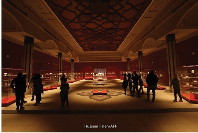
صورة (4) تمثل متحف البصرة الحضاري (فالح، 2023)

يُميز مدينة البصرة، كما تم التركيز على "متحف البصرة الحضاري" الذي شهد توافد عدد كبير من السائحين، ومثال على ذلك صورة (4) التي التقطها المصور الصحفي (حسين فالح):