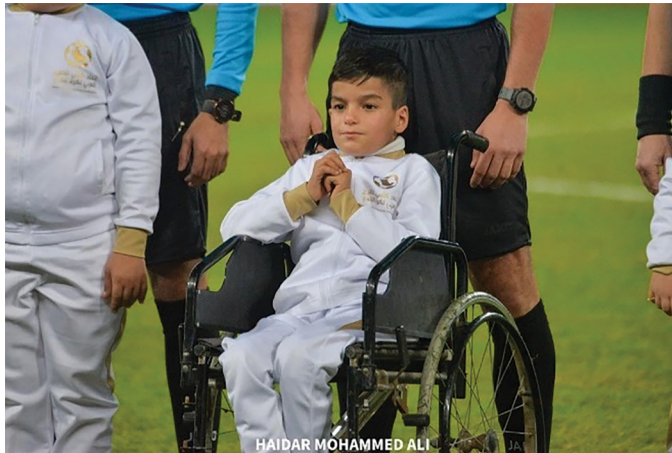
صورة (5) ل احد الأطفال من ذوي الإعاقة المشاركين بحفل ختام كأس الخليج (علي، 2023)

5. أوضحت نتائج الدراسة حصول فئة "صور حضور ومشاركة مرضى السرطان وذوي الاحتياجات الخاصة بكأس الخليج" على المرتبة الخامسة بتكرار مقداره (21) وبنسبة مئوية مقدارها (3.088%)، إذ لاحظت الباحثتان تسليط الضوء من قبل المصورين على ذوي الاحتياجات الخاصة سواء ذوي الإعاقة أو المصابين بمتلازمة داون، فمنهم من كان حاضراً ضمن الجمهور، ومنهم من كان مشاركاً بحفل الختام مع الفريق، وهذه الخطوة التقاثة رائعة لدمج هذه الشريحة بالمجتمع كونهم جزءاً منه، ومثال على ذلك صورة(5) التي التقطها المصور الصحفي الحر "حيدر محمد علي":