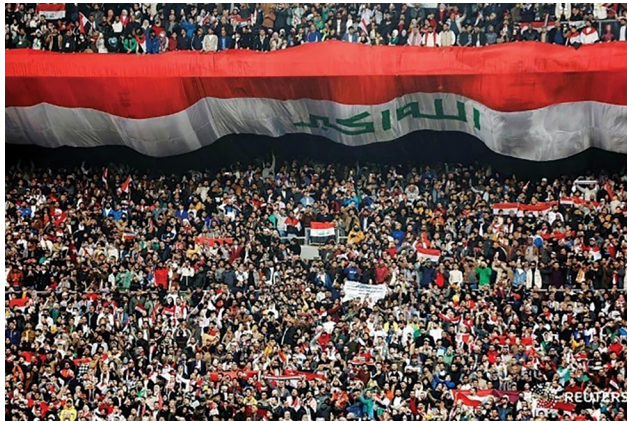
صورة (2) للجماهير المشجعة بأحد مباريات كأس الخليج (السوداني، 2023)

2. حصلت فئة "صور الجماهير المشاركة في بطولة كأس الخليج" على المرتبة الثانية بتكرار مقداره (215) وبنسبة مئوية مقدارها (31.617%)، وفي هذه الفئة لاحظت الباحثان تركيز المصورين الكبير على الجماهير المشجعة سواء داخل الملعب أو خارجه، ولا سيما المشاهير منهم الذين حضروا مع الجماهير سواء كانوا من العراق أو من دول الخليج، كما تم التركيز بشكل كبير على الجماهير الحاملين للافتات ذات مضامين طريفة، إذ أن هذا النوع من الصور يتم تداوله بشكل كبير من قبل مستخدمي مواقع التواصل الاجتماعي لذلك نجدها تحظى باهتمام المصورين الصحفيين، ووجدت الباحثان أن المصورين لم يهتموا أيضاً بتوثيق توافد الجماهير إلى مدينة البصرة فضلاً عن توثيق لحظات توافدهم إلى الملاعب، بالمقابل لاحظت الباحثان قلة اهتمام المصورين بتغطية منطقة المشجعين خارج الملاعب التي كان لابد لهم من تسليط الضوء عليها، إذ لم تكن هذه الجماهير أقل شغفاً عن الجماهير المشجعة داخل الملعب لذلك كان من الممكن أن يتم تسليط الضوء على هذه الشريحة من الجماهير من قبل المصورين الصحفيين. ومثال على هذه الفئة صورة (2) التي التقطها المصور الصحفي (ثائر السوداني):